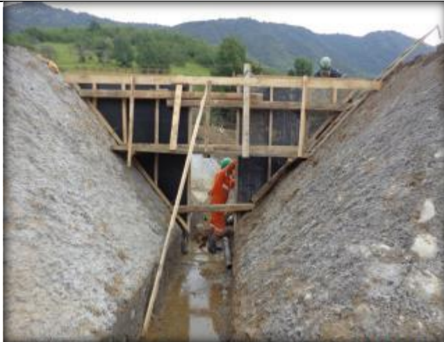
Moldaje para compuerta de quebrada CQ7, Km 11,407.