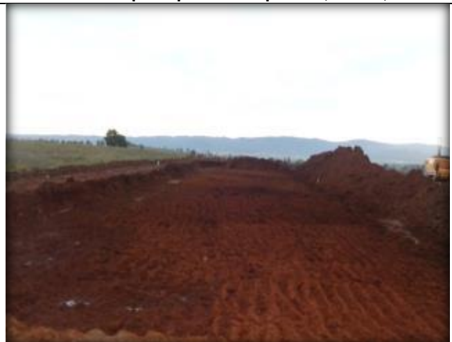
Escarpe, Km 49,600.