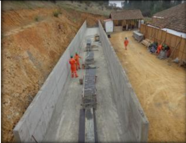
Canal rectangular de hormigón, Km 4,460.