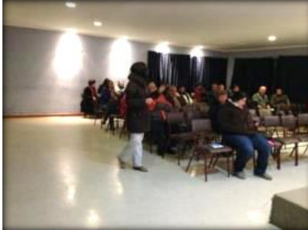
Expone Encargada de Territorio y Medio Ambiente, medidas ambientales.