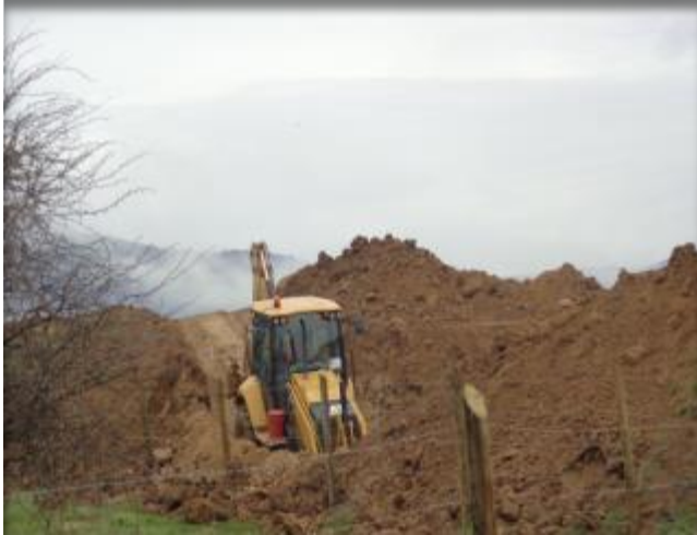
Excavación para instalación de manifold.