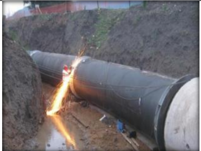
Soldadura de tubos de acero, curva horizontal C 5 (Km 0,870-Km 0,900).