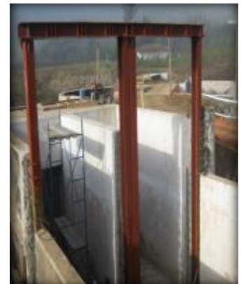
Insertos metálicos para compuertas.