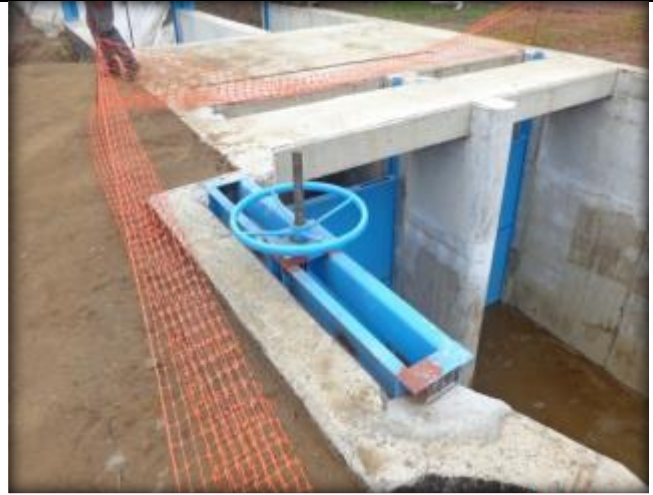
Avances en la instalación de marcos de compuertas.