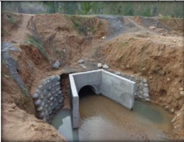
Muro de boca con alas, Km 19,060.