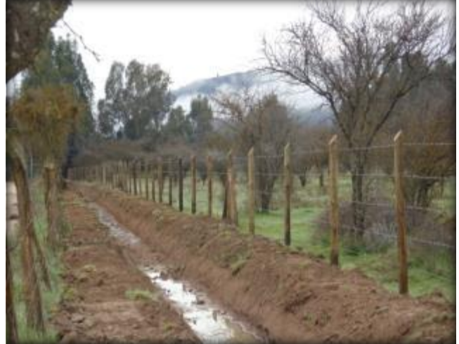
Canal desagüe del vertedero de seguridad.