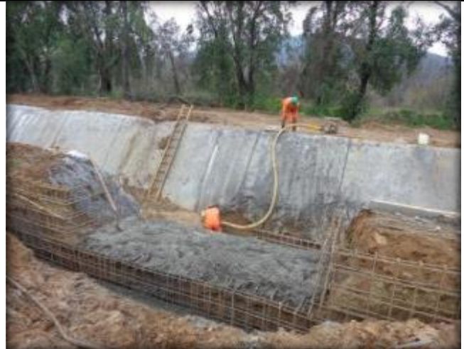
Descarga Tipo 1, Km 0,992.