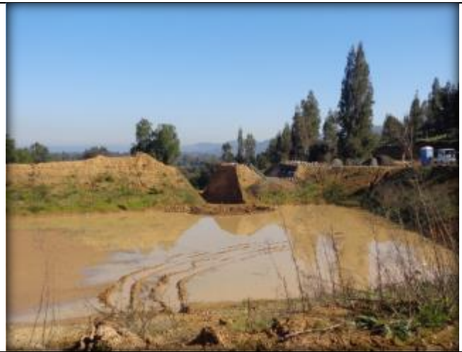
Excavación para instalación de manifold.