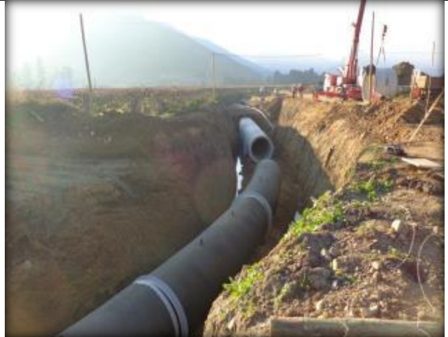
Moldaje para tubo de acero, Km 0,880.