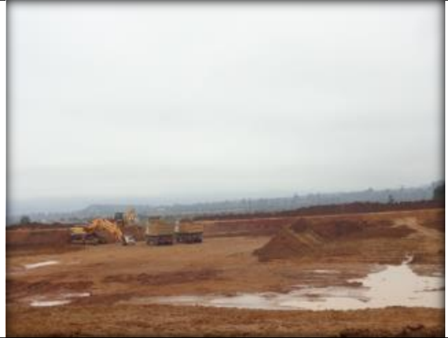
Movimiento de tierras.