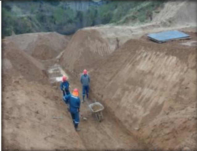
Cruce de quebrada Tipo CQ7, Km 35,090.