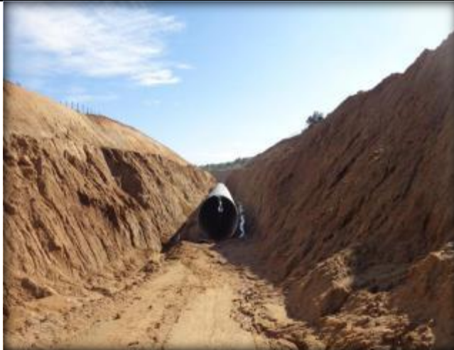
Tubo corrugado, Km 21,100.