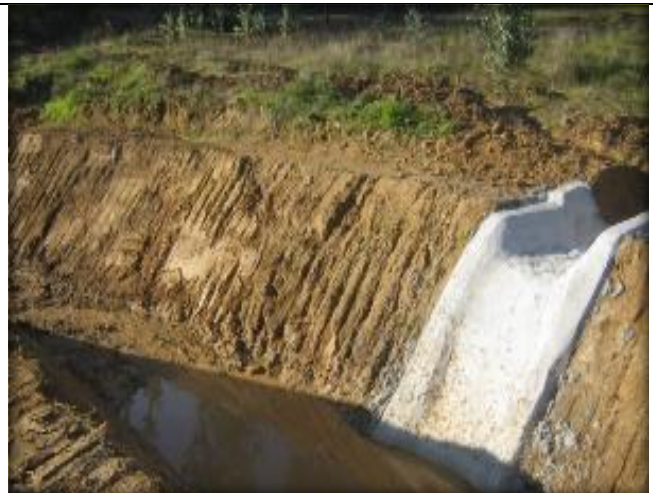
Hormigón proyectado en descarga de quebrada, Km 25,420.