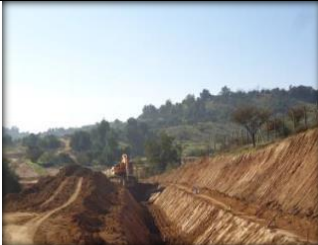
Armado de tubo corrugado, Km 21,100.