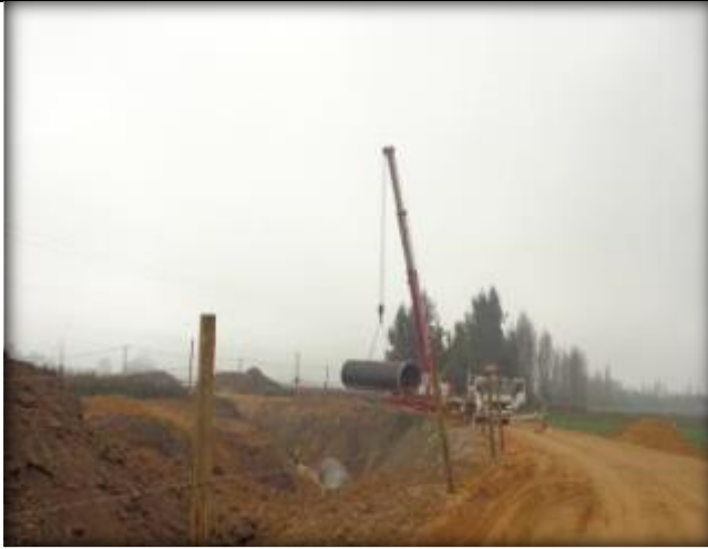
Instalación de tubería.