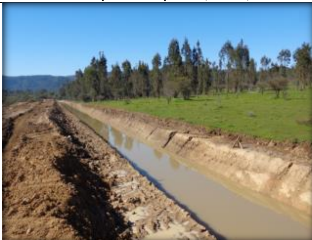
Corte de canal, Km 44,200.