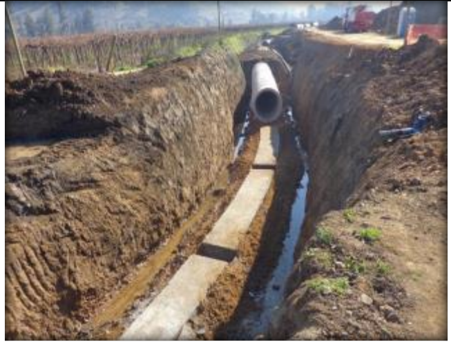
Emplantillado para tubo de acero, Km 0,860.