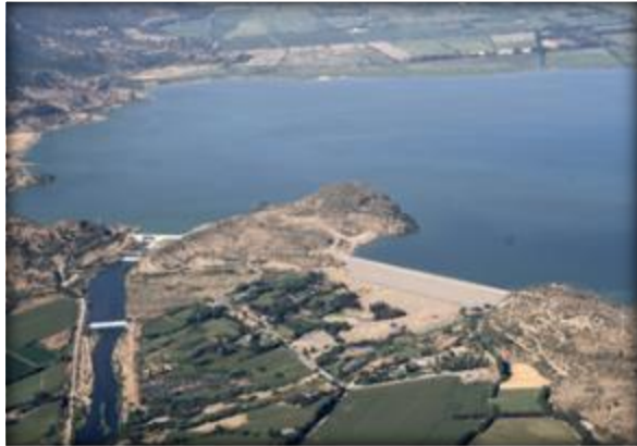
Zona de Presa y Embalse Convento Viejo.