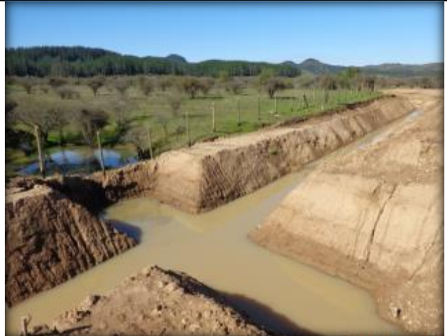
Excavación para quebrada Tipo CQ7, Km 42,089.