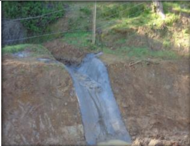
Descarga Tipo 1, Km 22,740.