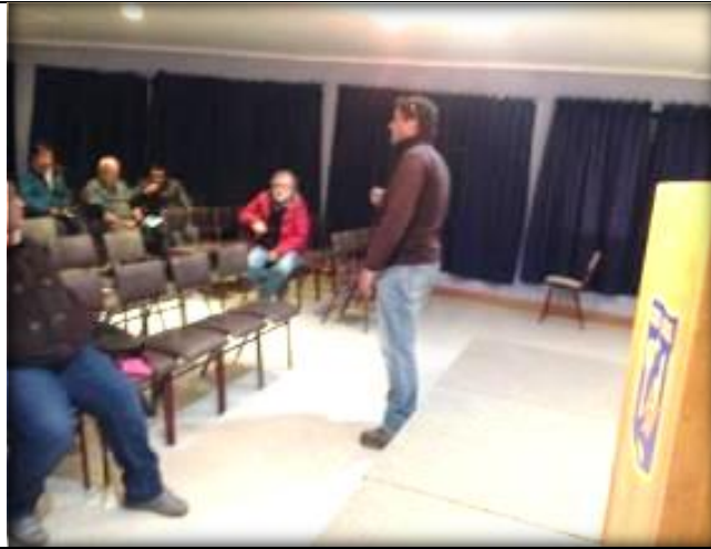
Expone Prevencionista de Riesgo, medidas de prevención de la obra.