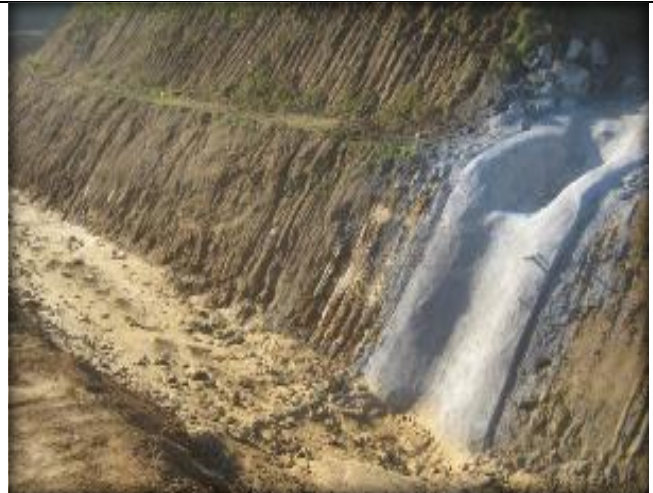
Descargas de quebrada, Km 24,480.