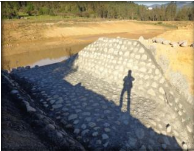
Mampostería del vertedero.