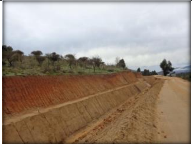
Corte de canal, Km 21,620.