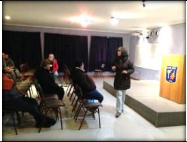
Expone Encargada de Territorio y Medio Ambiente, medidas ambientales.