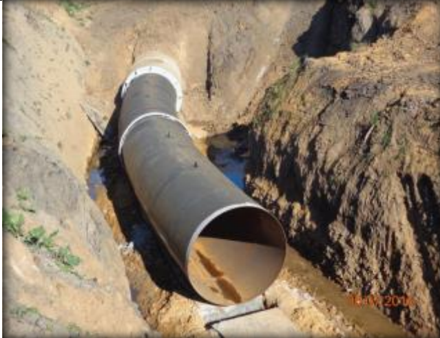
Moldaje para tubo de acero, Km 0,910.