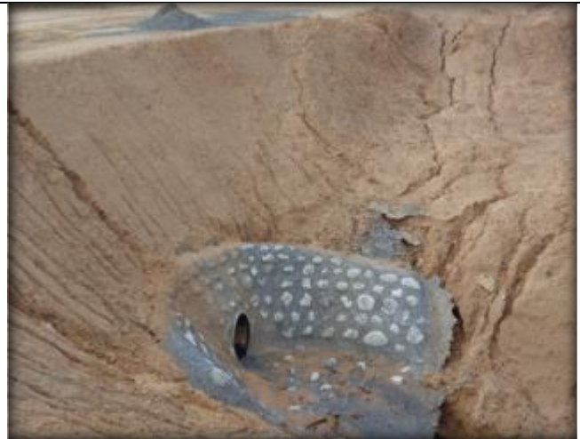
Mampostería, Km 23,880.