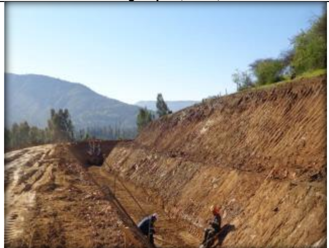
Corte de canal, Km 4,200.