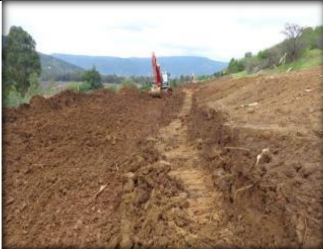
Escarpe, Km 3,900.