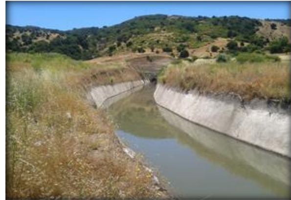
Sector de salida poniente Túnel La Lajuela.