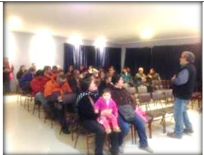
Expone Encargado de Oficina Técnica, características del proyecto.