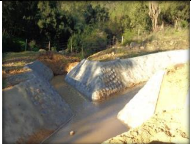
Mampostería para quebrada CQ7, Km 14,785.