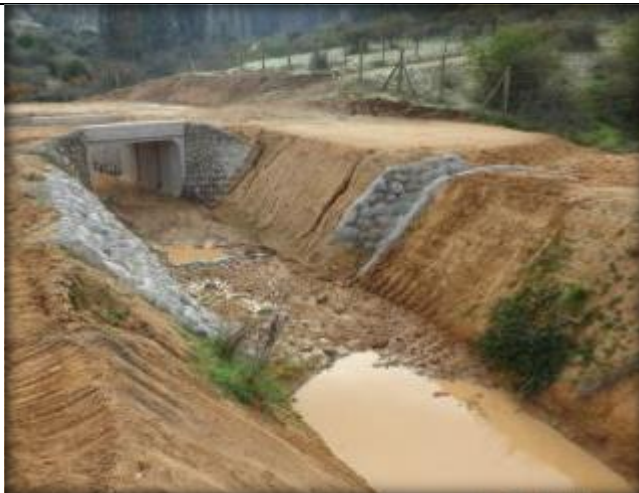
Descarga de quebrada, Km 26,640.