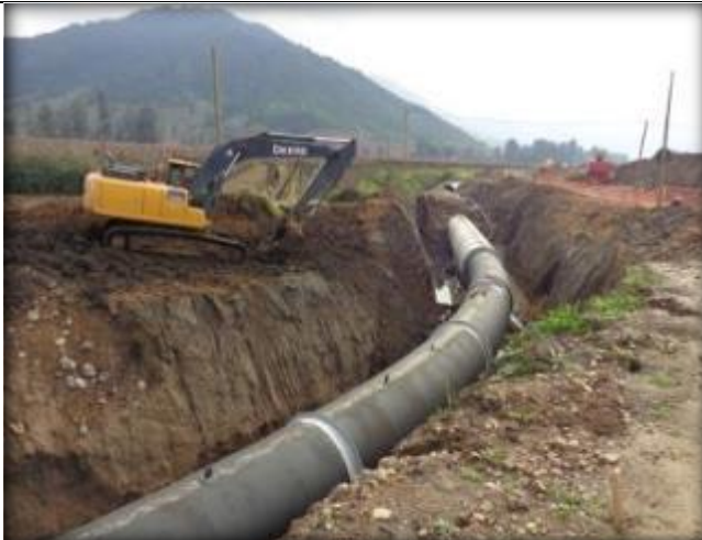
Tubo de acero, Km 0,900.