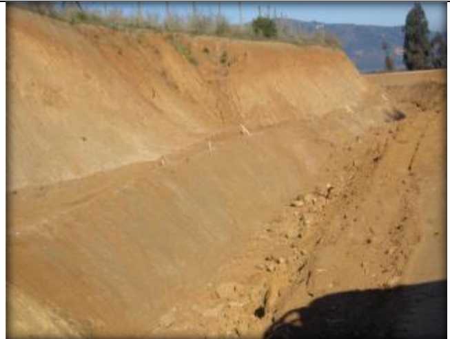
Corte de canal, Km 21,200.