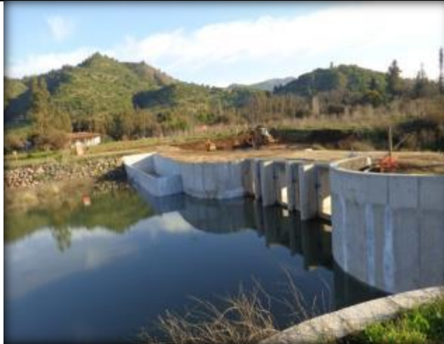
Instalación de compuertas para canal de descarga y alimentación.