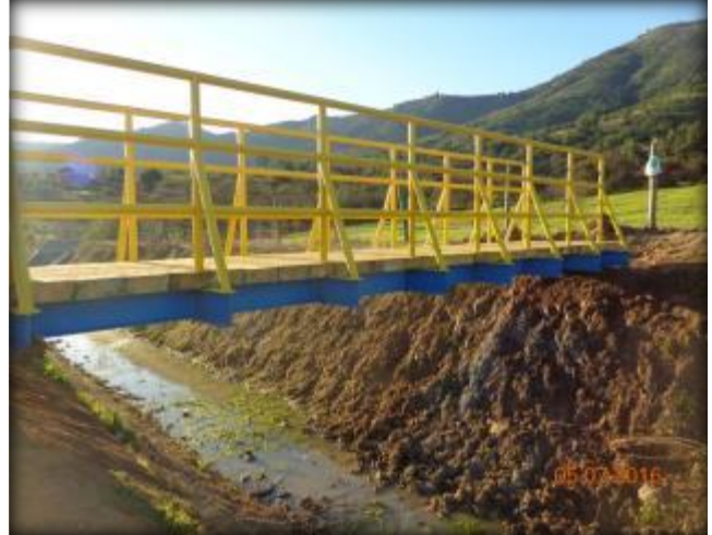
Pasarelas para paso de Ganado, Km 17,760.