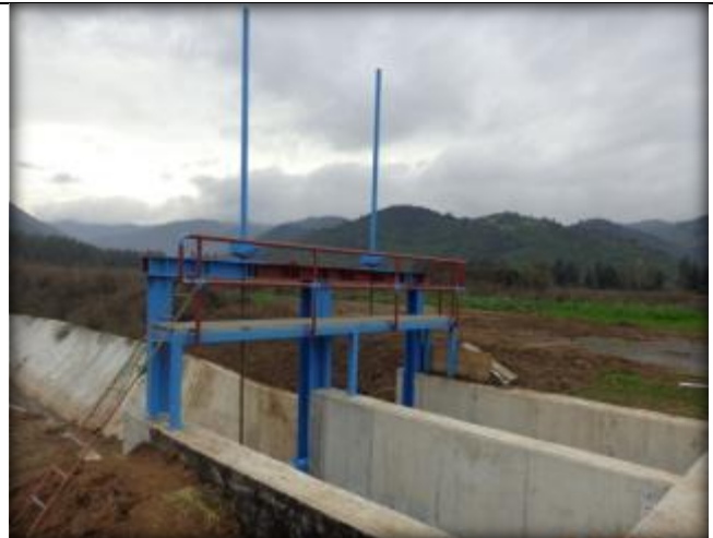
Avances en la instalación de marcos de compuertas.