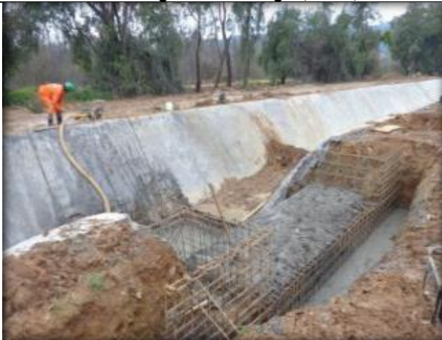
Descarga Tipo 1, Km 0,992.