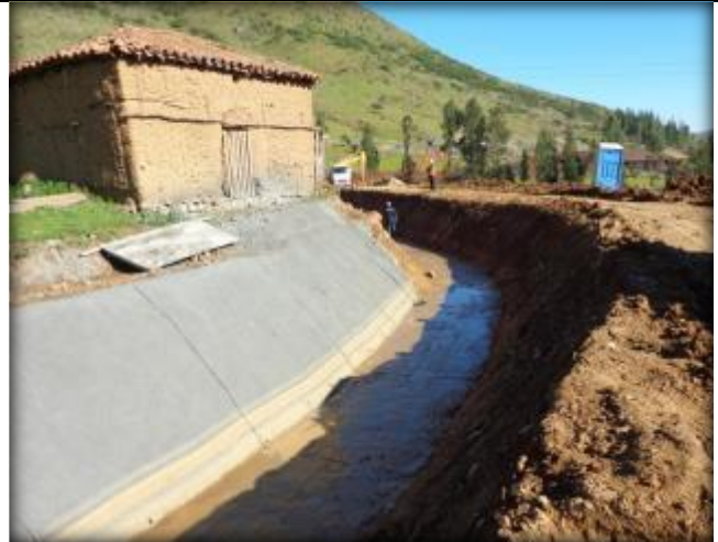
Hormigonado de canal, Km 4,200.