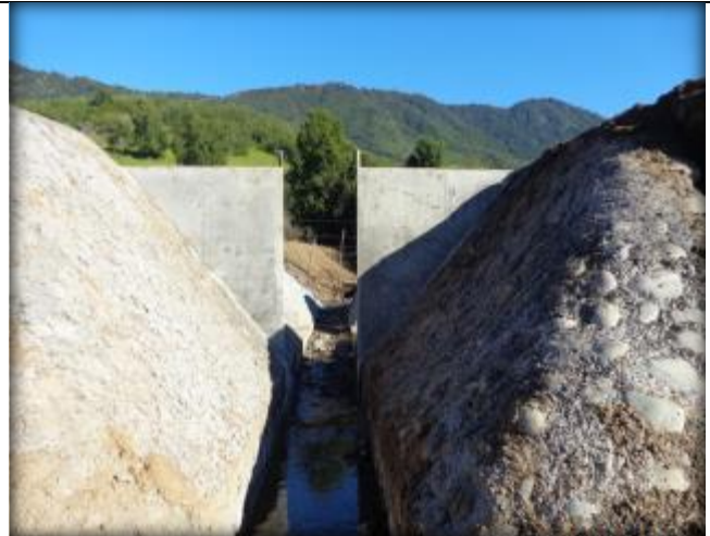
Hormigonado de compuerta para quebrada CQ7, Km 11,407.